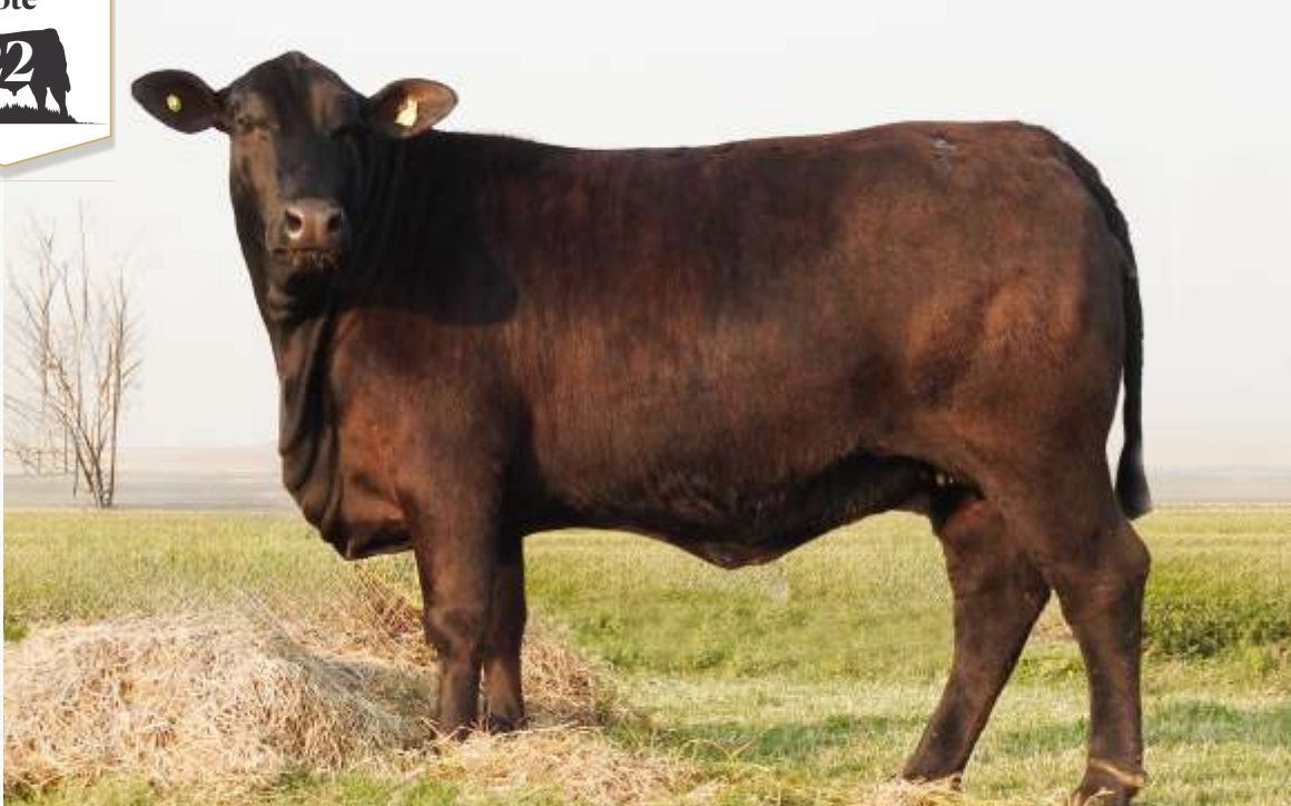
BRANGUS LA REINA RINCON 2032