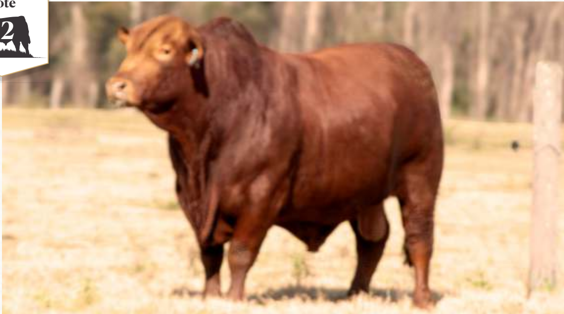
TELLECHEA 202 VIAMONTE