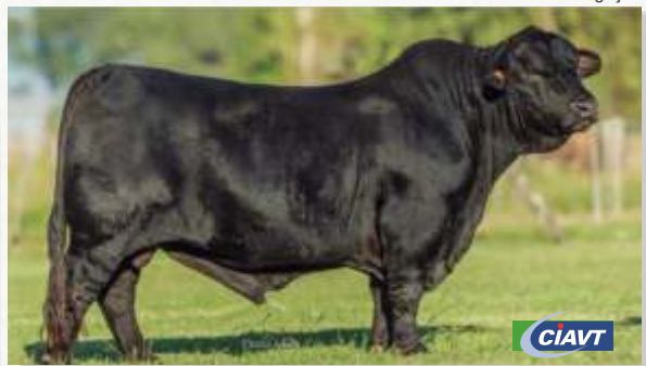
ORIGENES ELEGIDO "TERCO"

Apostamos muito no cruzamento com o Terco, um dos touros com progênie mais destacada na Expobrangus 2024 e reconhecido por imprimir muita correção e pureza racial