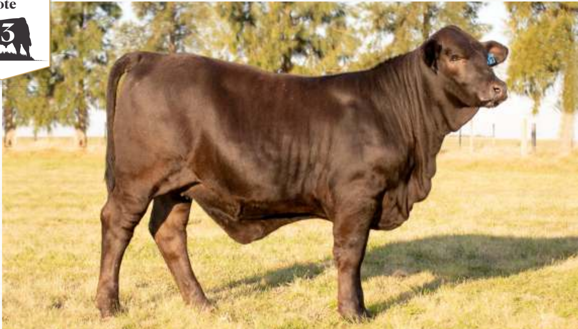
TELLECHEA FIV 397 TERCO