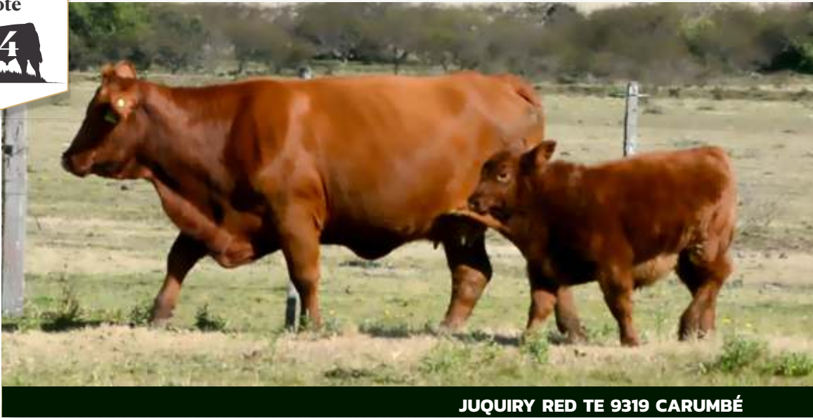
JUQUIRY RED TE 9319 CARUMBÉ