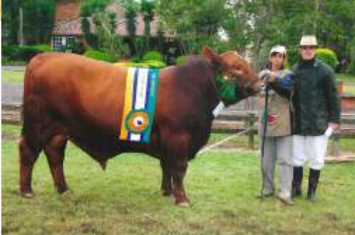
...cada ...n. 2009

AGROPECUARIA ARGENTINA DE BRANGUS... 1985