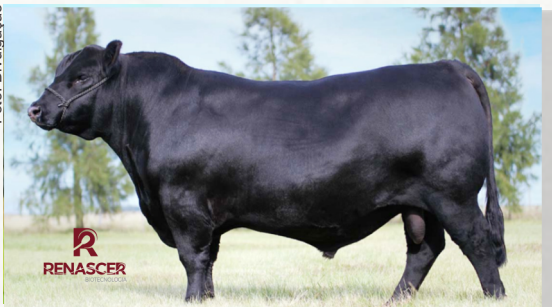
TELLECHEA 3450 CONFIDENCE - "PRADO"