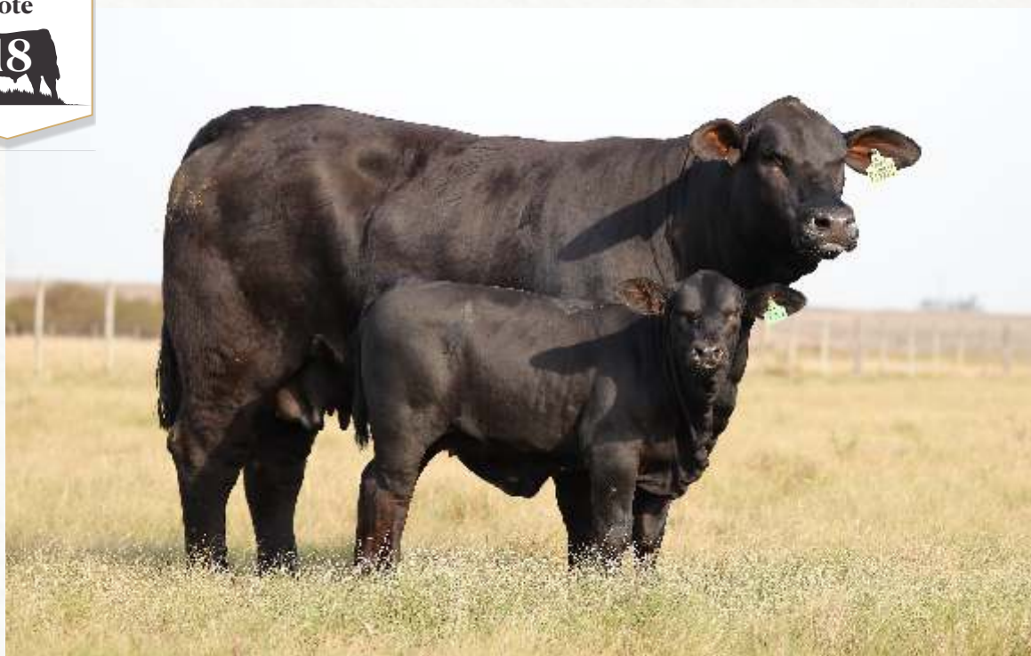
JUQUIRY BLACK FIV9517