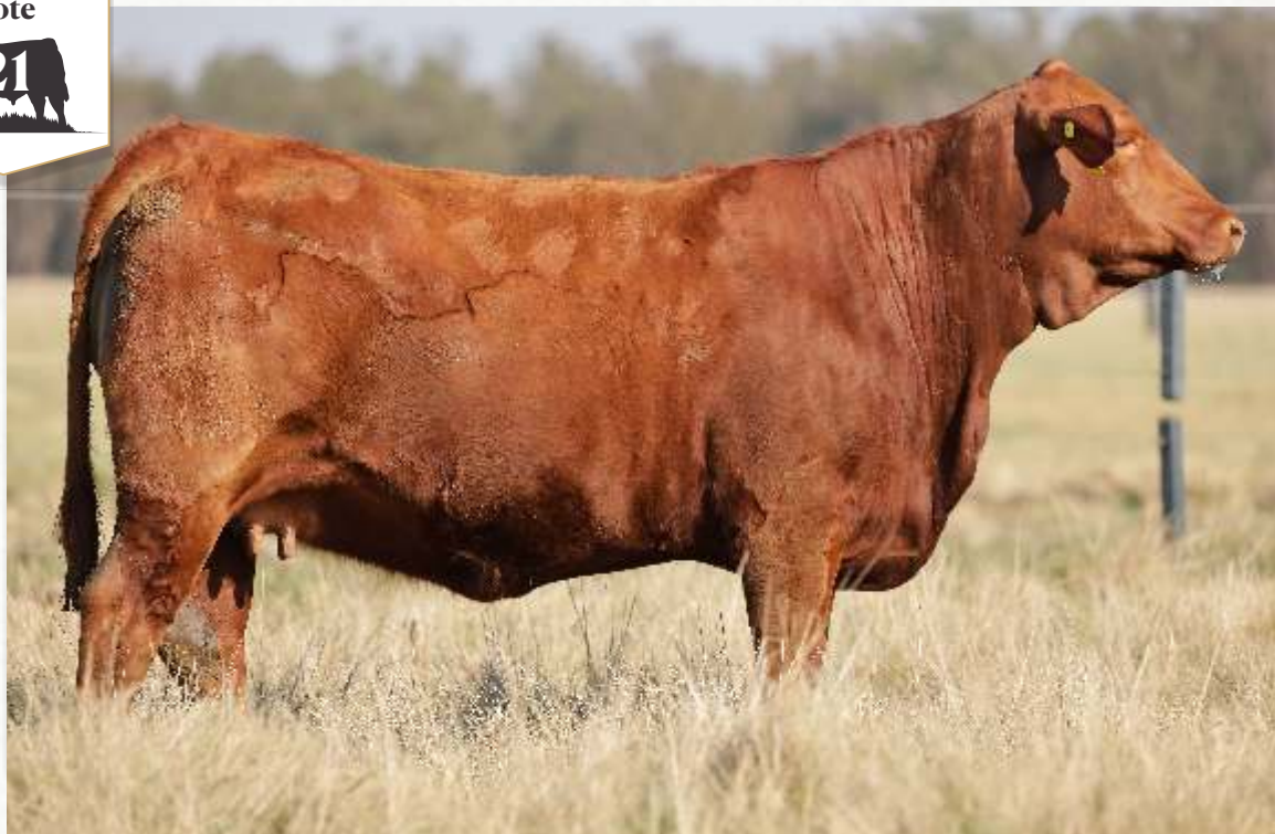
BRANGUS BRASIL B1934 DO MANANCIAL