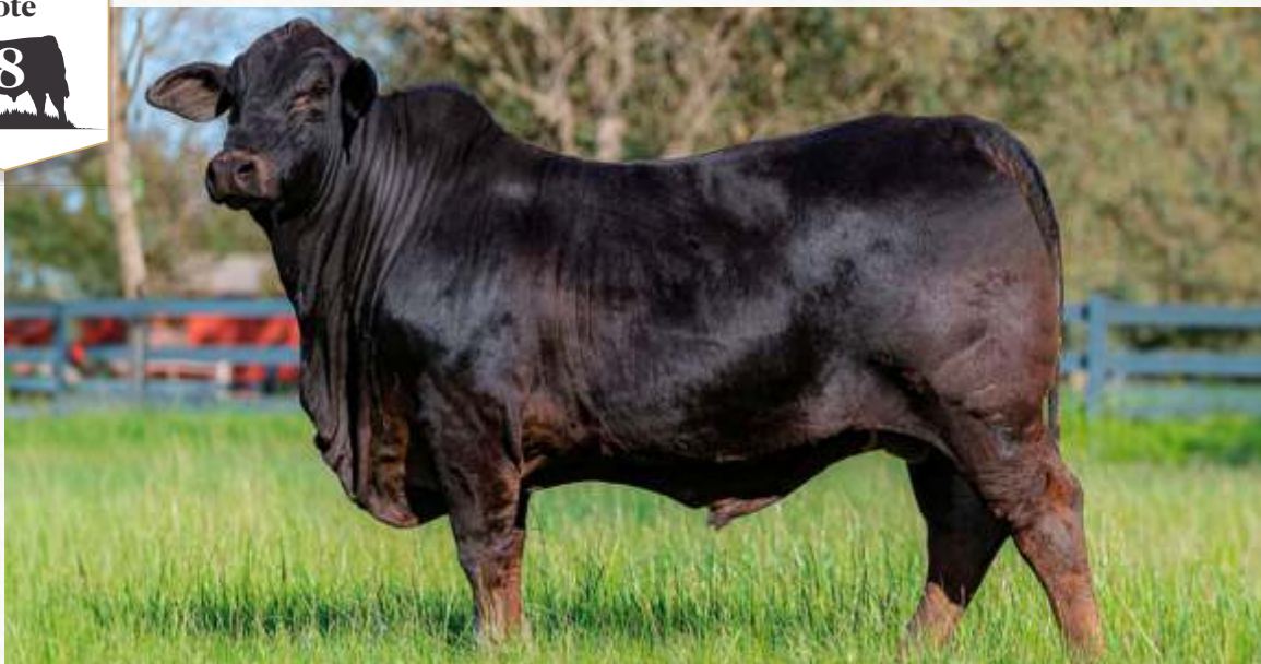
TELLECHEA 008 THE ROCK "MANDRAKE"