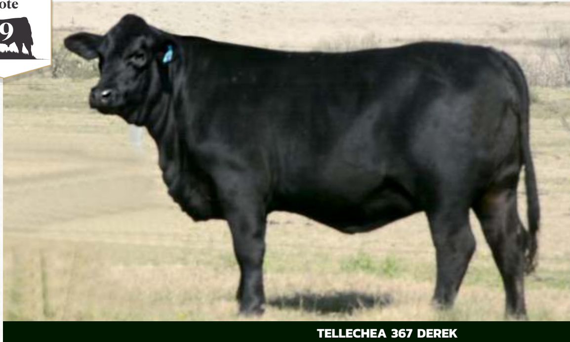
TELLECHEA 367 DEREK