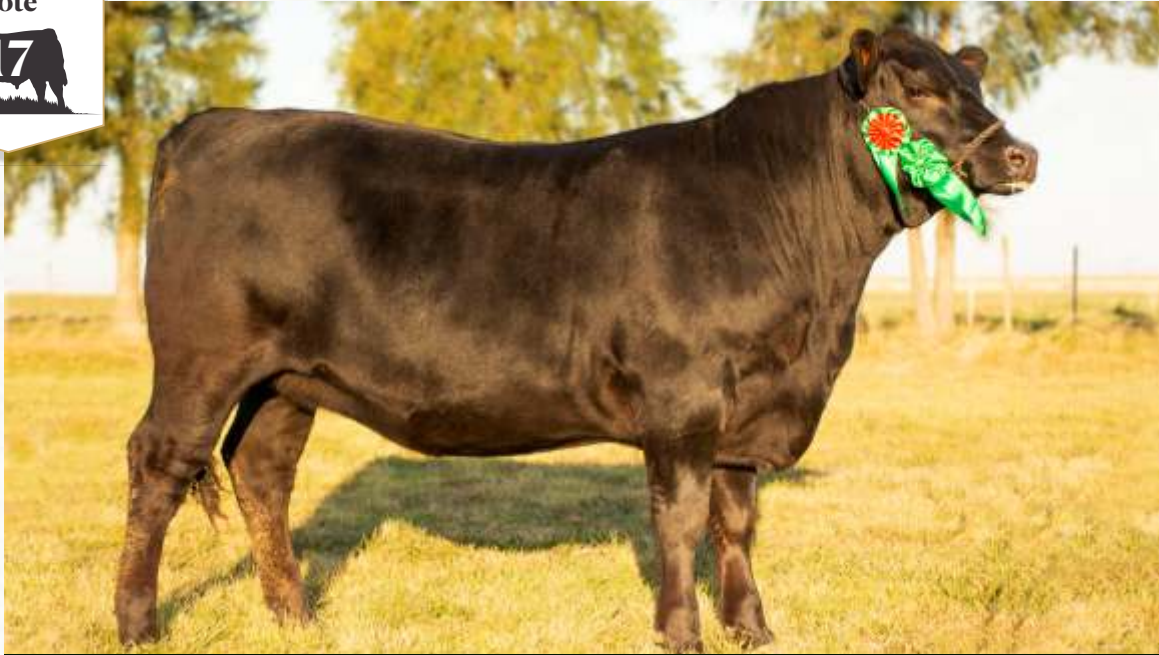
TELLECHEA UB 03 HOME TOWN