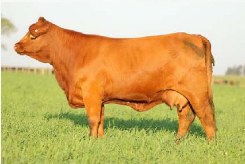
Mãe: JUQUIRY RED TE 9319

Campeã Vaca Rústica na Exposição Nacional Brangus 2023