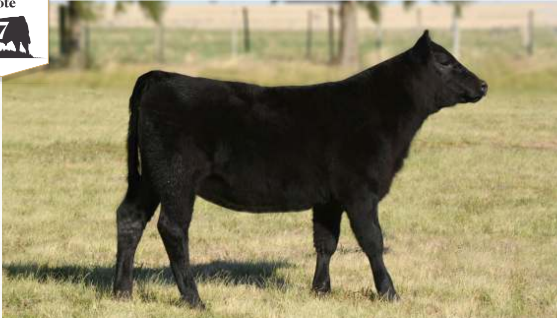
TELLECHEA 4327 ROSE