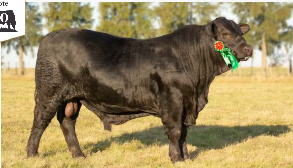
TELLECHEA 266 FIV7400 FRANCESCO