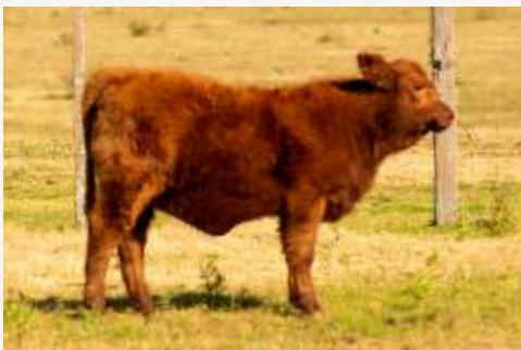
TELLECHEA SORPRESA "FORMA" Produto resultante deste cruzamento.