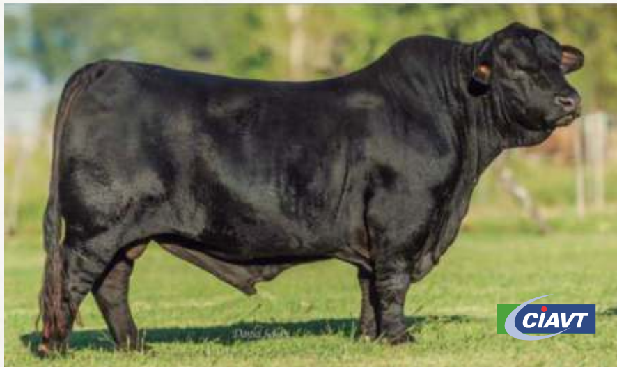
ORIGENES ELEGIDO "TERCO"