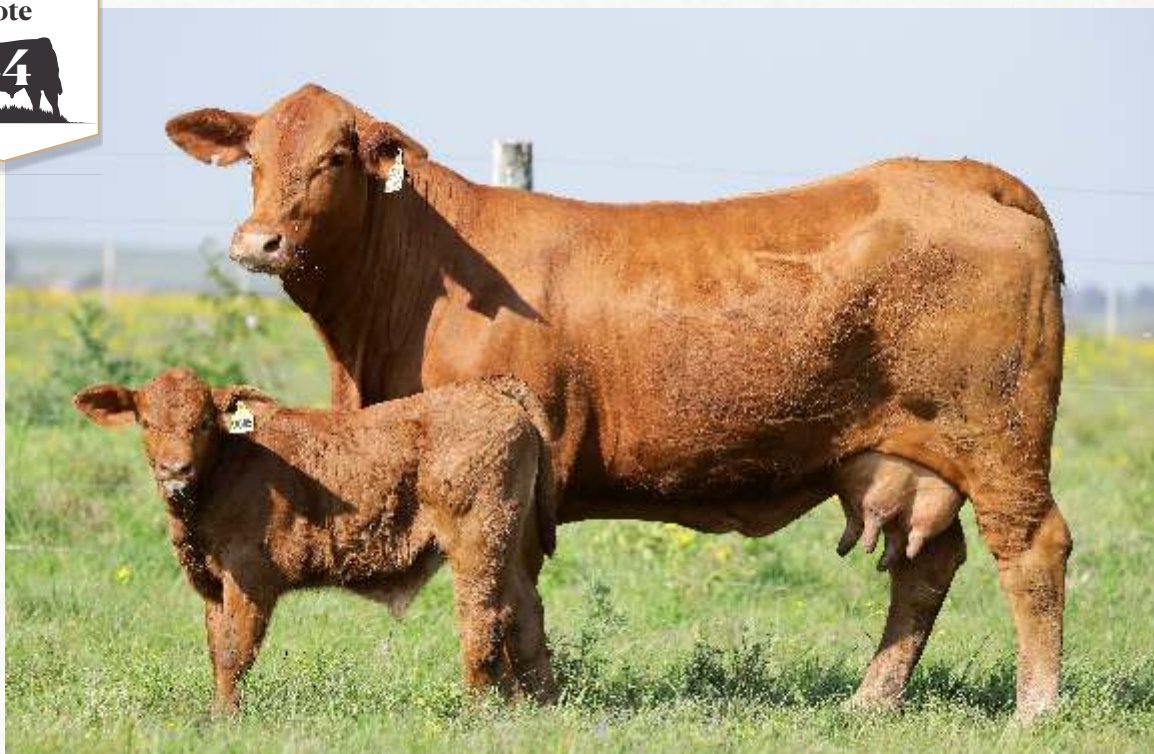
JUQUIRY TE9085 RED WINE 7601GLD