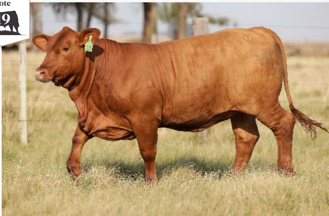
JUQUIRY TE35 CAUT TE9085RW