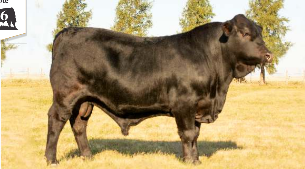
TELLECHEA UB10 ADDITION