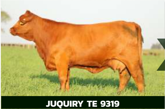
JUQUIRY TE 9319