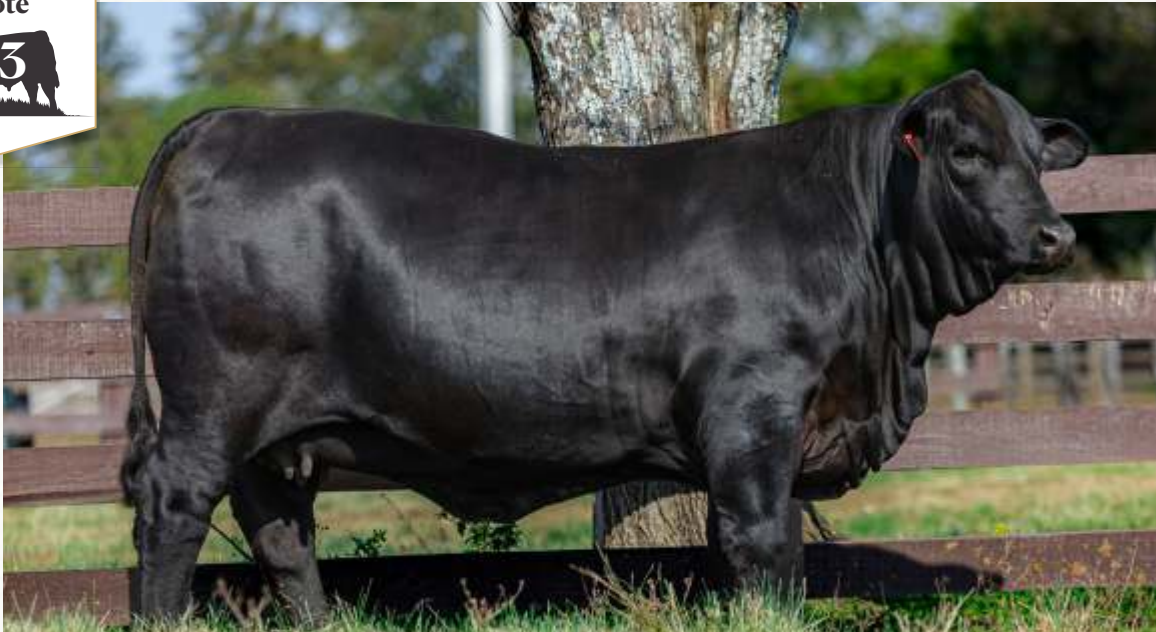
SÃO BIBIANO CHEETARA TE5566