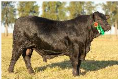
TELLECHEA 266 FRANCESCO * Filho da doadora Juqiry TE 9319 Campeão Junior na Exponacional Brangus 2024

*Venda de um pacote de embriões (3 embriões com garantia de 1 prenhez).