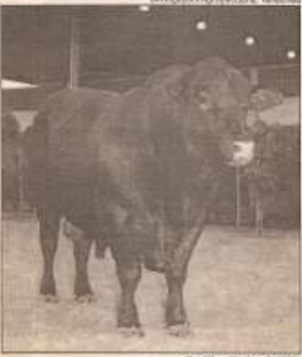
Rediba Federal 3720

Thulo foi conquistado com o touro Rediba Federal 3720 durante a 6ª. Exposição Nacional