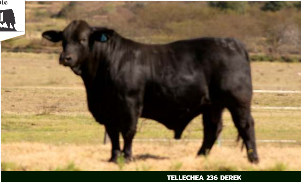
TELLECHEA 236 DEREK