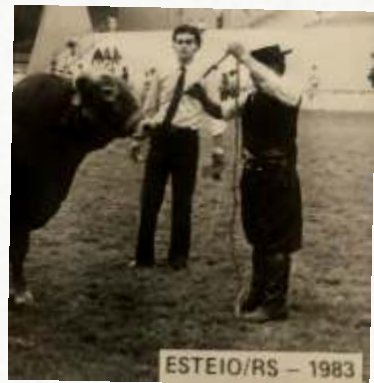
ESTEIO/RS - 1983

AGROPECUARIA ARGENTINA DE BRANGUS... 1985