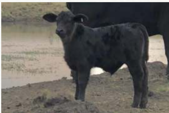
*Filho FIV - 367 x TERCO

Destaca-se na Avaliação do Promebo como Elite de sua geração, com Índice de Desmama +20,67 (Top 5%) e +18,86 (Top 8%) no Índice Final.